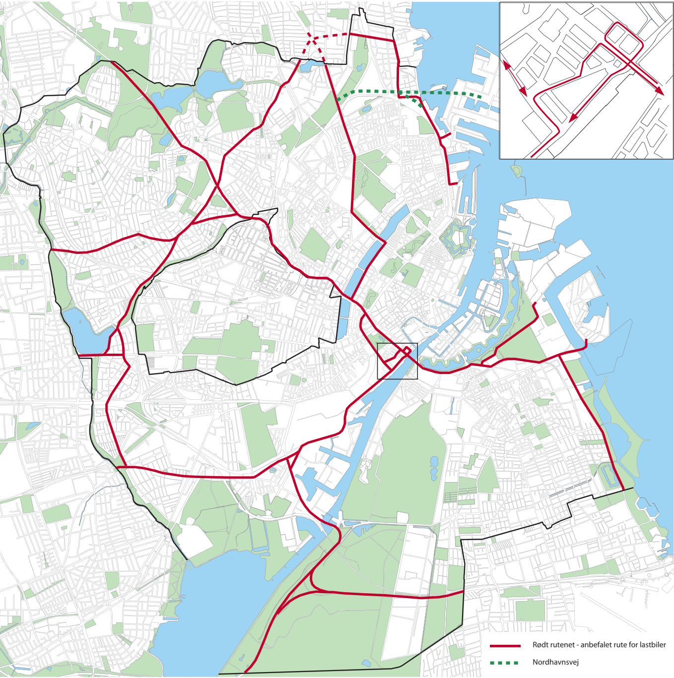
Rødt rutenet - anbefalet rute for lastbiler Nordhavnsvej