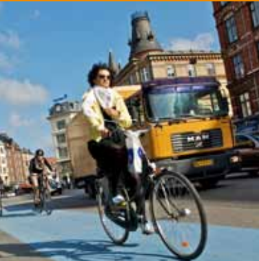
Det anbefalede rutenet for lastbiler - fuldt implementeret