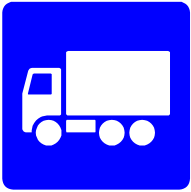
Anbefalede rute for lastbiler - eksempel fra Strandvænget